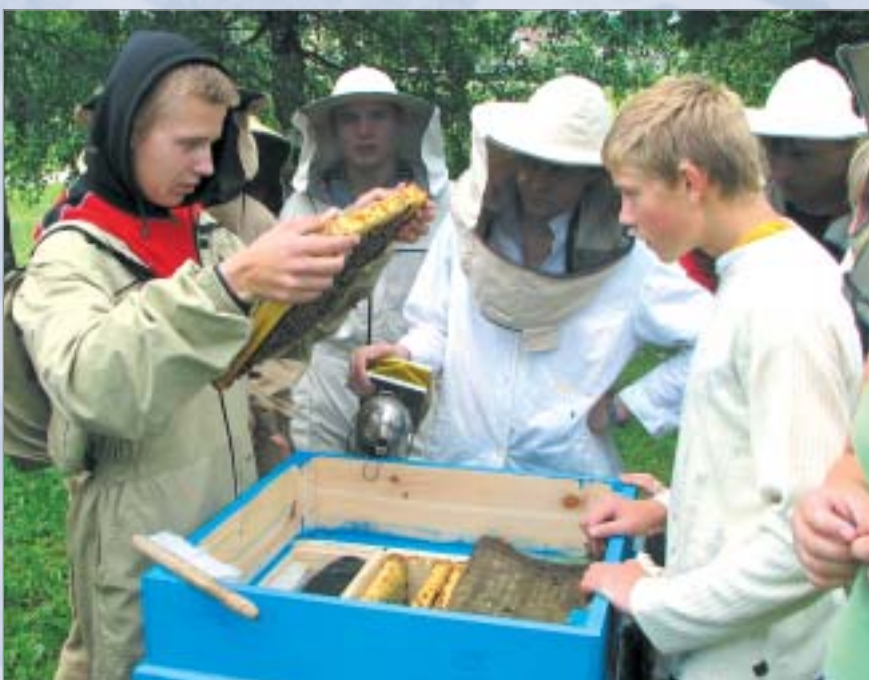
Biškopības speciālitātes audzēkņi darbā pie jaunajiem stropiem

māja ir ieguvusi visu svarīgāko un nepieciešamāko sekmīgai biškopja izglītības programmas apguvei. Medus sviešanas telpa pilnīgi ir apgādāta ar visu nepieciešamo inventāru – ir gan medussviede, gan atvākojamais galds, gan fasēšanas iekārta un atsildīšanas sistēma. Mums, iespējams, vienīgajiem Latvijā ir arī medus nostādīšanas vanna, kas no medus nodala vaska daļas. Rezultātā iegūstam ļoti tīru medu. Iegādājāmies arī 50 Latvijas koka stāvstropus un 10 poliuretāna daudzcorpasa stropus, lai varētu parādīt jaunajiem specialistiem, kā ar tādiem var strādāt. Mūsu rīcībā tagad ir inventārs, kas nepieciešams darbam grupās, kā arī spectērpi, kas nepieciešami darba drošībai, un apkāres, mākslīgās šūnas, jo mēs plānojam paplašināt bišu saimes līdz 100. Turklāt esam iekārtojuši arī mācību kabinetu, nomainot galdus, krēslus, kas jau bija savu laiku nokalpojuši. Nākotnē jāmeklē iespējas, kā atrisināt transporta problēmu, lai mums būtu, ar ko pārvadāt stropus medus ieguvei.