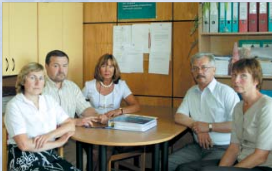
Projekta īstenošanu darba apspriedē