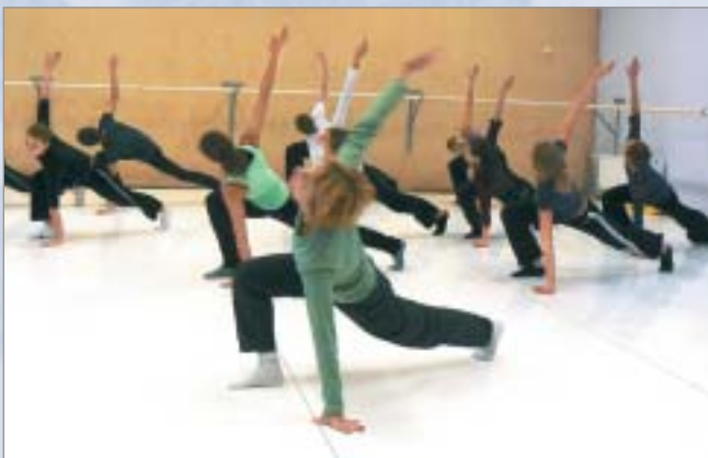
Vieslektores Rhodas Manes modernās dejas praktikums

Katra aktivitāte, katrs solis projekta īstenošanā paplašina pedagogu un audzēkņu redzesloku, sniedz jaunu informāciju, palīdz rast un nostiprināt kontaktus, labāk izprast savu vietu mūsdienu mainīgajā pasaulē. Zināmas grūtības paredzēto pasākumu īstenošanā saistās ar nepietiekami iepļānoto administratīvo nodrošinājumu. Tā ir pirmā pieredze, to izmantosim, veidojot nākošos projektus.