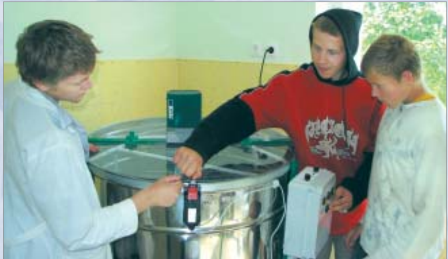
Izremontētajā dravās mājā audzēkņi iepazīst jauno medusviedi

stundās būtu materiāli, ir jāstrādā. Turklāt arī tad, ja skolotājs sagatavo mācību materiālu, bieži vien skolai nav iespēju to iesiet un pavairot, jo arī pīrs ir dārgs. Strukturfondu projekti palīdz šīs lietas risināt: metodiskais darbs ir apmaksāts, iegādājāmajos biroja tehniku – datoru, printeri, iesējēju, laminatoru – un tagad paši varam pavairot sagatavotos mācību materiālus.