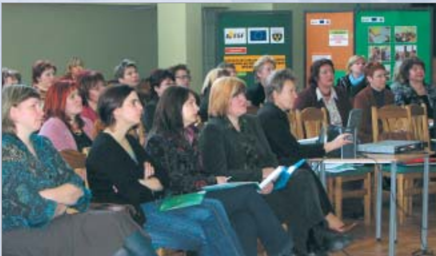
Projekta konferences dalībnieki, apspriežot atbalsta sistēmas izveides jautājumus jauniešu ar speciālām vajadzībām

Rūpes par bērnu ir atstātas uz vecāku pleciem, ir pienācis laiks mainīt uzskatus, ka bērni ar invaliditāti ir tikai nelabvēlīgajās ģimenēs. Ja skolas saņemtu lielāku valsts atbalstu specializēto programmu ieviešanā, arī skolām būtu lielākas iespējas tās īstenot. Būtu jābūt principam, ka nauda seko līdzi bērnam. Dotācijas ļautu arī pilnveidot mācību procesu. Ir lietas, kas neprasa lielus finansiālus ieguldījumus, ir tikai jābūt vēlmei panākt pretī un pasniegt palīdzīgu roku.