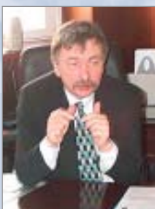
LU prorektors Indriķis Muiznieks:

Savukārt ERAF nacionālās programmas "Atbalsts zinātniskās infrastruktūras modernizēšanai valsts zinātniskajās institūcijās" projekti ir vērsti uz zinātniskās infrastruktūras modernizēšanu Latvijas Universitātes dabas zinātņu fakultātes un institūtos. Tādējādi abu struktūrfondu projektu sinerģija veicina gan tehnoloģisko, gan cilvēku resursu atjaunināšanu zinātniskās darbības pētniecībā un attīstībā.