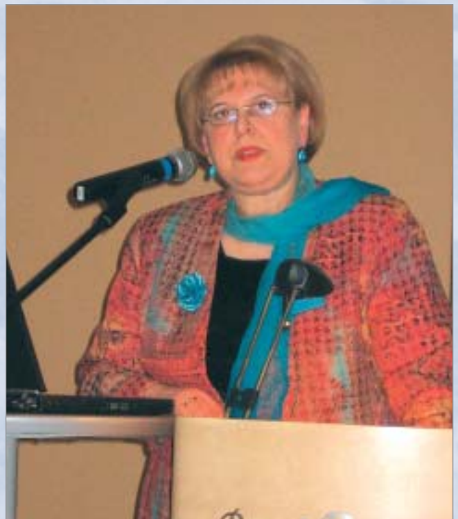
Par augstākās izglītības politiku Latvijas konkurētspējas celšanā stāsta Augstākās izglītības padomes priekšsēdētāja, akademiķe B. Rivža