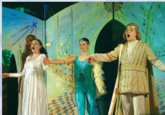
Jaunie solisti uzvedumā „Lolitas brinumputns”

Otra ļoti būtiska lieta, ko studenti iegūst no šī prakses projekta, ir iespēja iepazīties ar Latvijas reģioniem un izprast potences veidot savu karjeru ārpus Rīgas. Jārēķinās ar to, ka ne visiem pēc akadēmijas beigšanas būs nodrošināta darba vieta Rīgā. Turklāt reģionos aizvien vairāk trūkst cilvēku ar muzikālo izglītību, kas strādātu mūzikas skolās, koledžās vai spēlētu vietē-