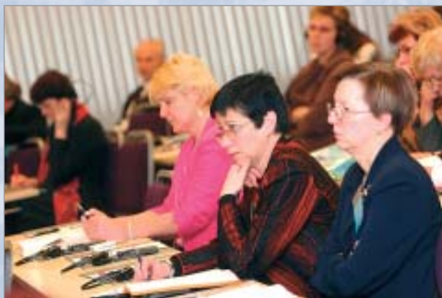
Tautsaimniecības un izglītības nozaru eksperti foruma darba brīdi