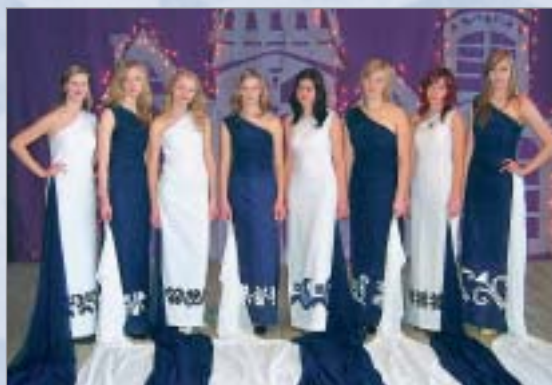
11. un 12. klases meitenes demonstrē projekta laikā tapušo tērpu kolekciju „Ornamenti”

Esam uzņēmuši arī videofilmu par mūsu skolu, lai iepazīstinātu citu rajona skolu audzēkņus ar šeit apgūstamajām programmām. Tas bija mūsu pirmais šāda tipa eksperiments. Bērni gan plānoja filmas sižetu, gan filmēja, gan montēja. Esam ierakstījuši uzņemto filmu kompaktdiskos, kas tagad kalpo kā reprezentatīvais materiāls gan par skolu, gan par īstenoto ESF projektu.